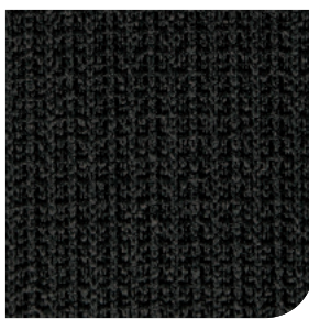
Ribstrikket (Antracit og Sort, kun i AD)